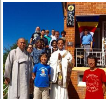
Annual Hana matsuri service (10/04/16)

In May we observed Annual Gotan-e , celebrating Shinran Shonin's birthday, followed by the Annual General Meeting (15/05/16). Then I attended several Vesak ceremonies in Sydney.