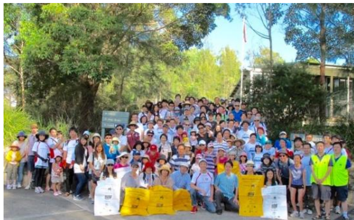
Group photo of the Clean up Australia Day at the Lane Cove National Park (06/03/16).

First of all, on New Year's Day, we observed Shu-Sho-e