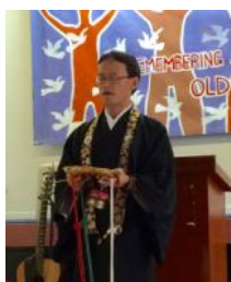
(下)リズモア市での平和式典での読経(25/04/16)