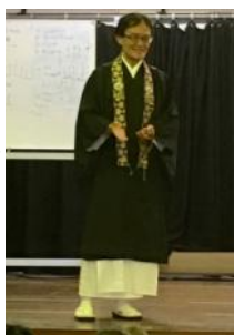
Talked about Buddhism for all Y-4 Students at LEPS (13/10/16).

Of course, we continue to hold our regular Sunday services at the HBMA, to which we always invite as many people as possible. Please keep inviting your friends to our services!