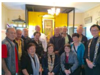
12 Hawaiian members visited HBMA. (25/08/16)