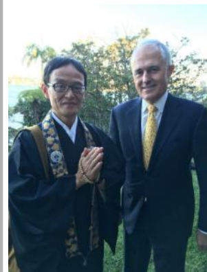
With Honourable Malcolm Turnbull MP Prime Minister of Australia(16/06/16).

by the Most Reverend Anthony Fisher of St Mary's Cathedral to attend their IFTER dinner (8 Jun). then it was also my honour to be invited by Honourable Malcolm Turnbull MP Prime Minister of Australia to Join the IFTER dinner held at the Kirribilli House on 16 June. On 5 August, I officiated at the Cowra Prisoner of War Breakout - 72nd Anniversary Service of Respect . We observed our Annual Obon ser-