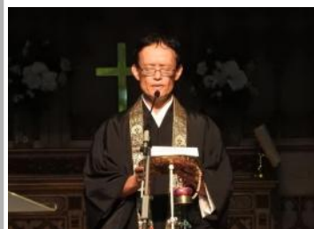
5th year memorial service for the 3.11 Japan earthquake in Manly