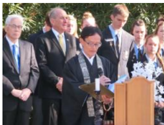
"Service of Respect" at the Cowra POW cemetery (05/08/16)