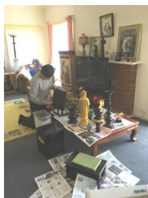
HBMA shrine became very shiny and clean! (11/12/16)

On 11 December, we once again held Omigaki day when we had last Sunday Service in 2016. The HBMA shrine became very clean as we polished all the ornaments in the shrine and wiped all the chairs in the