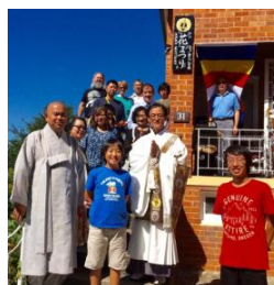
(上)花祭り法要での集合写真(10/4/16)