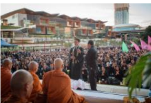
I chanted in front of 20,000 Thailand related people (17/10/16).