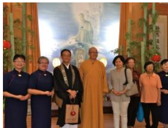
Attended the New Year Blessings at Tzu-Chi foundation. (21/02/16)

In February, we observed the Nehan-e (Nirvana Day) service (14/02/16). I was also once again invited to attend a New Year Blessing at the Buddhist Compassion Relief Tzu-Chi Foundation in East-