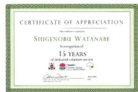
ボランティアの賞状

5月3日にロイヤルノースショア病院で行われたボランティア表彰式に出席し15年の賞状を頂きました。またこの月はお釈迦様の誕生・成道・入滅を祝うウエサク月ということで、1日はカルナ基金、8日は午前中に南天寺、午後は慈済基金(8日)、28日はベトナム寺のウエサク法要に参列し読経を行ってきました。5月15日には降誕会&年次総会が滞りなく執り行なわれました。