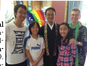
Anzac Day Peace ceremony in Lismore.(25/04/16).