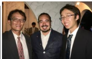
With Adam Liaw at the Japanese emperor's Birthday party

teacher at Lindfield East Public School , and I am looking forward to starting this task again from next month! For our Japanese community group called " Japan Club of Sydney ", I volunteer as one of the directors and mainly help with producing their newsletters.