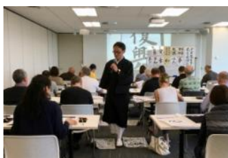
Shomyo & Shakyo class was held at Japan Foundation. (24/09/16)