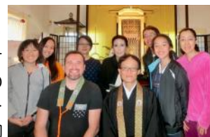
リンドフィールドでの最後のお参り(16/07/17)