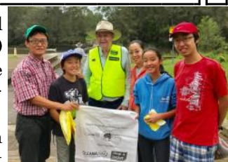
On Clean-up Australia day, we fortunately met Mr Ian Kiernan, the founder of CUA. (05/03/17)

In July, we received notice from house owner of 31 Woodlands Rd, Lindfield to vacate the premises, but fortunately we were able to find a new place in a week, and we relocated our centre to 732 Pacific Hwy on 30 July. Then