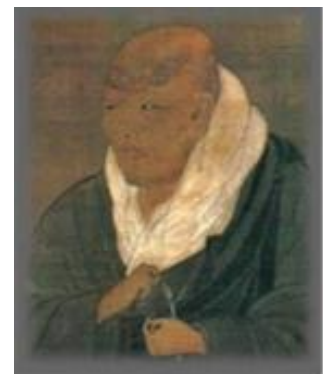
親鸞聖人 Shinran Shonin (1173-1263)

《Songo shinzo meimon / Notes on the inscriptions on sacred scrolls》