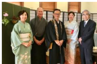
With Tanko-kai members

which was a very rare occasion (11/10/17),