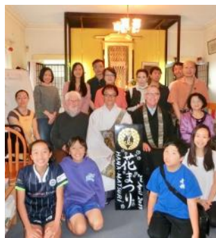
Annual Hana matsuri service (02/04/17)