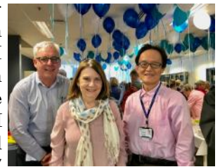
RNSH's Chaplain staff

Volunteer work is very important to keep connecting with our communities. First of all, I help as a hospital chaplain every week — mainly at the Royal North Shore Hospital . I also visit nursing homes and other aged care facilities. 2017 was my ninth year as a volunteer Buddhist Scripture teacher at Lindfield East Public School . For our Japanese community group called "Japan Club of Sydney", I volunteer as one of the directors and mainly help with producing their newsletters.