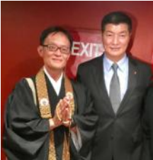
With Dr Lobsang Sangay . (05/08/17)

on 20 August we officiated the first service, Obon at the new Hondo with many new faces in the congregation. During resettling of the new Hondo, I was invited to join the Royal North Shore Hospital Volunteer appreciation day (23/07/17), and also joined a lecture made by Dr Lobsang Sangay , the de-