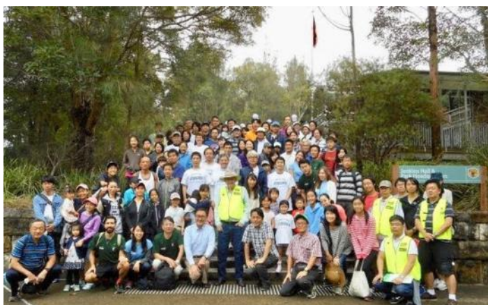
Group photo of the Clean up Australia Day at the Lane Cove National Park with Mr Ian Kiernan; the founder of CUA(05/03/17).