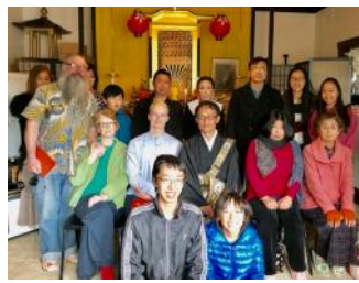
Obon service was conducted at the new HBMA Hondo(20/08/17)

East Public School as I am volunteering there as a Buddhist Scripture teacher (28/11/17). In December, I was honoured to be invited to attend the Japanese emperor's birthday party at the Consul General's residence (05/12/17). Then, we were all involved with the Matsuri Japan festival (09/12/17), and did annual Omi-