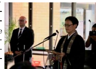
6th year memorial service for the 3.11 Japan earthquake in Chatswood