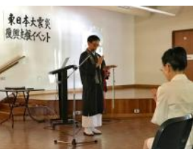
チャッツウッドでの東日本大震災6周年追悼式典にて