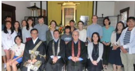
Hoonko Service 2017 (12/11/17)