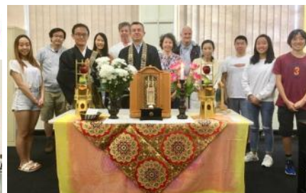
Ho-on-ko 2019 at Gordon Library