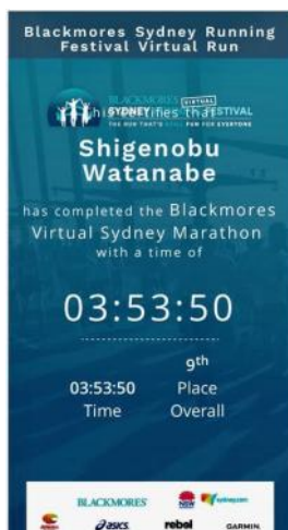
Result of the run! (27/09/20)