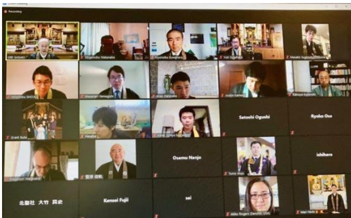
Overseas ministers from America, Canada, Brazil, German, and also other ministers from Japan joined the session. (12/10/20)