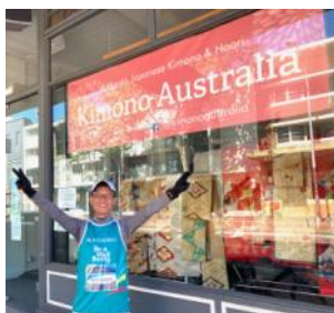
Made U-turn at Kimono Australia Pop-up Shop in Paddington (27/09/20).

With the Royal Botanic Garden on their left-hand side, they ran down to Hyde Park through Macquarie Street. Then turned left on Oxford Street towards Paddington. Then they made a U-turn and went back home using almost the same roads.