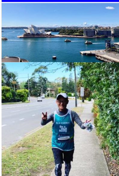
Almost goal! (27/09/20)