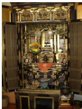
Adelaide Dojo's O-Butsudan (Buddhist Shrine)

this month. When we offer incense, one of us offers for each of the overseas members.