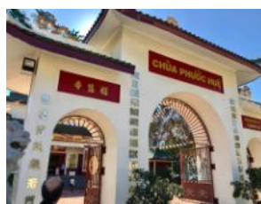
Phuoc Hue Vietnamese Temple in Wetherill Park